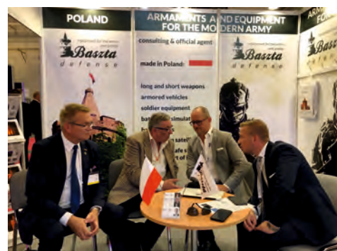
generał broni Waldemar Skrzypczak