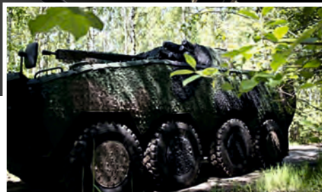
wozy opancerzone armored vehicles