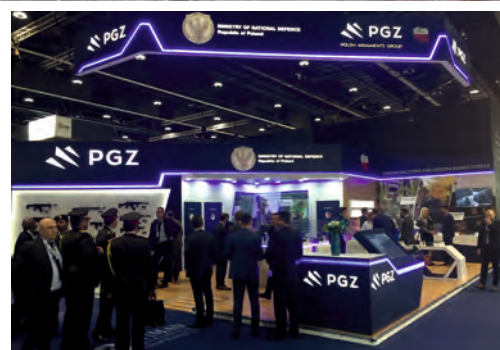
Polska Grupa Zbrojeniowa na targach w Abu Dhabi, 2019 r.