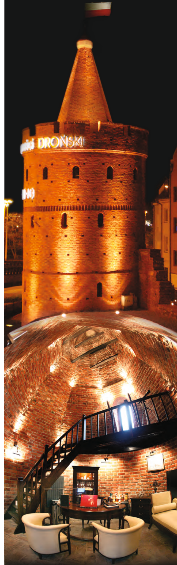
gabinet prezesa / president office