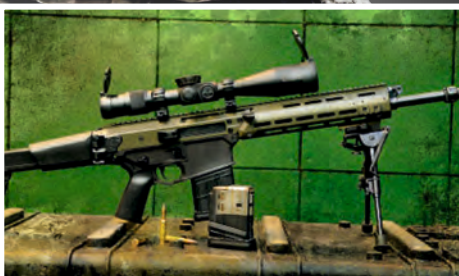
broń długa i krótka long and short weapon