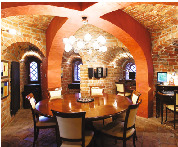
pokój konferencyjny / conference room