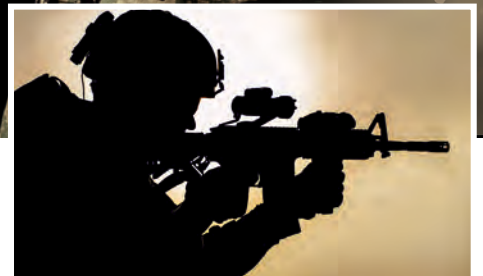
żołnierz przyszłości soldier of the future