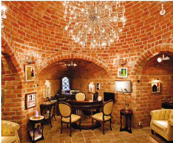
sekretariat / secretariat