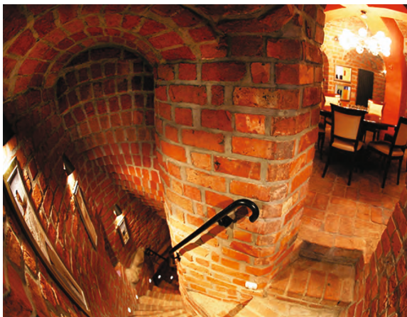
schody na piętro / stairs